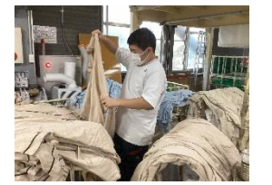
産業現場等における実習