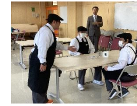
地域人材を活用した出前授業