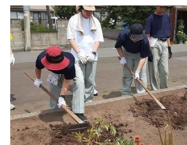
町内会との花壇植栽活動