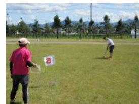
グラウンド・ゴルフ交流